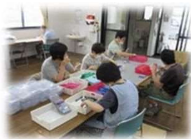
ボールペンセット作業