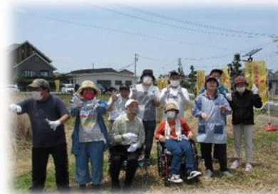
からし菜収穫体験