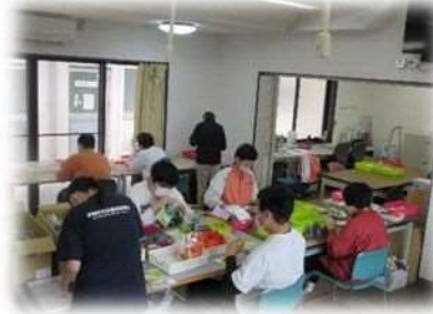
商品検品・袋入れ作業