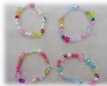
ビーズプレスレット