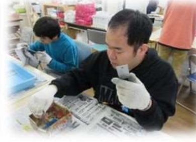
保護ビニール剥ぎ作業