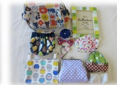
がまぐち・ポーチ等