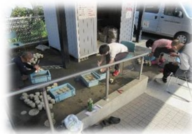
水道メータ 洗浄作業