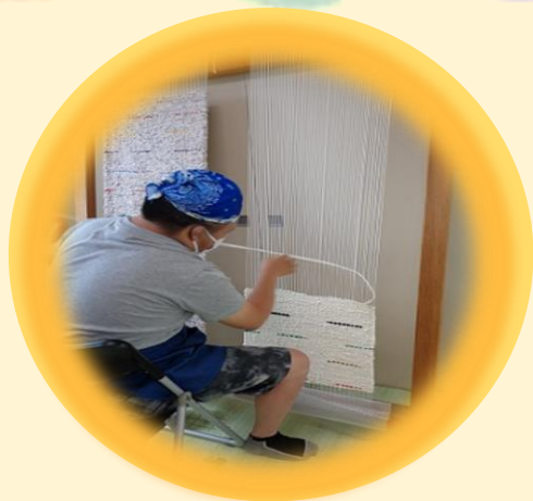
～「二見工房そみん」主な作業内容～