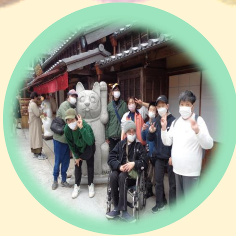
※ 月に一度の体験学習 ※

季節に合わせて月に一度体験学習を行っております。4月はお花見、8月は夏祭り、1月はいちご狩り、外食実習などのお出かけをします。 年2回火災訓練と避難訓練を行います。