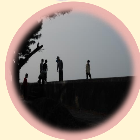
— 日課 —

二見工房そみんは、次のステップに進む第一歩を支援しています。 一生懸命頑張ることも大事ですが、ゆっくり自分のペースで、毎日過ごすことも大切です。 一人一人に合った支援に取り組んでいます。