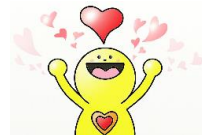
御蘭こども広場 マスコットキャラクター ごころん