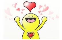
御菌こども広場 マスコットキャラクター ごろん