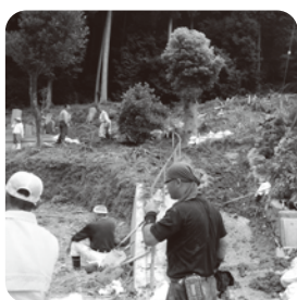
土砂の撤去の様子 (丹波市豪雨災害)