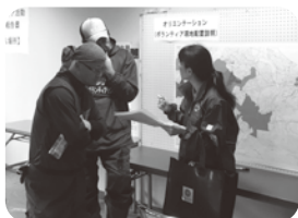
打ち合わせの様子 (平成29年台風21号豪雨災害)