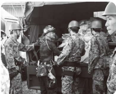
がれき撤去の様子 (東日本大震災)