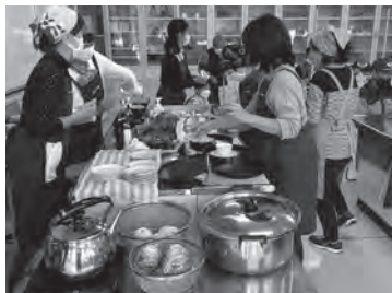
コーヒーを淹れて楽しくおしゃべり