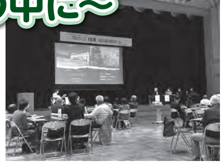
地域ささえあい活動セミナー

令和4年11月29日、人との交流の機会が少なくなった今、地域で人々がつながるための工夫などを話しあう「地域ささえあい活動セミナー つないでいこう地域の輪～あなたの思いが地域をつくる～」を開催しました。地域で人がつながるために、集いの場を継続していくための工夫やアイデア、困っていることなどについて話し合いました。