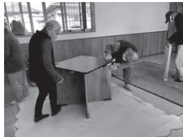
準備もみんなで行います