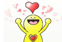
御園こども広場 マスコットキャラクター こころん

〒516-0804 三重県伊勢市御園町長屋 2767 (ハートプラザみその2階) TEL : 0596-22-7355 FAX : 0596-20-8617 メール : iseshakyo-honsyo@mie.email.ne.jp ブログ : (HP サイト内にあります) https://ise-shakyo.jp/