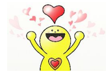
御園こども広場 マスコットキャラクター こころん

ブログ: (HP サイト内にあります) https://ise-shakyo.jp/