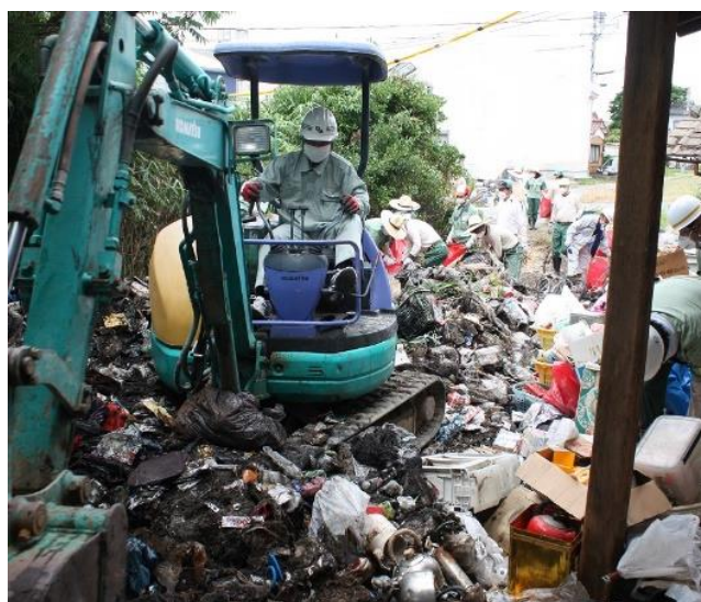
地域課題への協力