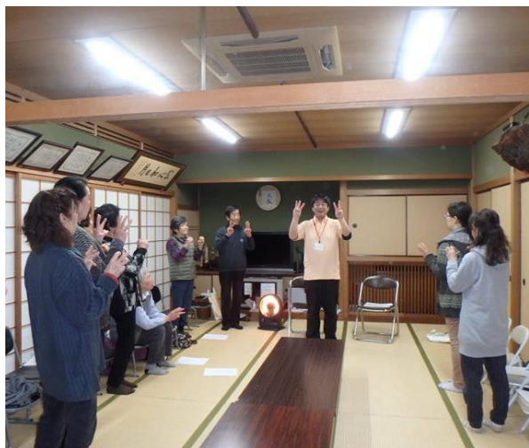
地域の集いの場で「出前トーク（脳トレ・体操）」を実施

実際に市内で活動をしている「ふれあいいきいきサロン」、「コミュニティカフェ」などの地域の集いの場や、「まちづくり協議会」などの地域活動に参加し、お手伝いをしたり、自社のスキルを活かした企画の実施などで集いの場などの運営サポート活動を体験します。