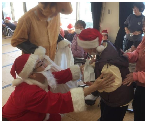
福祉施設イベントに参加

地域で開催されるイベント（まつり、ボランティア団体のイベント等）や、福祉施設や伊勢市社会福祉協議会等が実施するイベント（クリスマス会や工作教室、レクリエーションなど）のボランティアスタッフとして、イベントの運営のお手伝いを体験します。