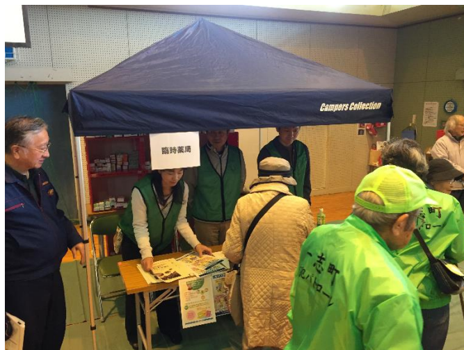
まちづくり協議会の避難所運営訓練でブース出展