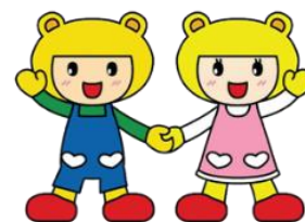
げんきくん&こころちゃん