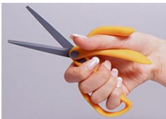
持ちやすく工夫されたハサミ

ユニバーサルデザインとは、はじめから誰もが使いやすい製品や建物、環境、サービスをデザインする考え方のことです。「ボランティア活動」や、「地域貢献活動」を実施する際の心得にもつながる身近な「ふくし」を知る入口として、ユニバーサルデザインの話を変えながら講話をします。普段の生活について改めて考えなおすと共に、他人のことを考え、譲り合いの気持ちを持ち「心のバリアフリー」へとつなげます。