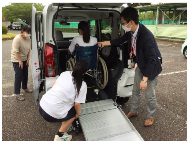
福祉体験学習への協力（福祉車両の提供）