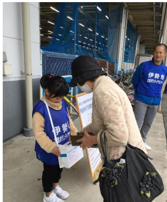
災害義援金募金への協力