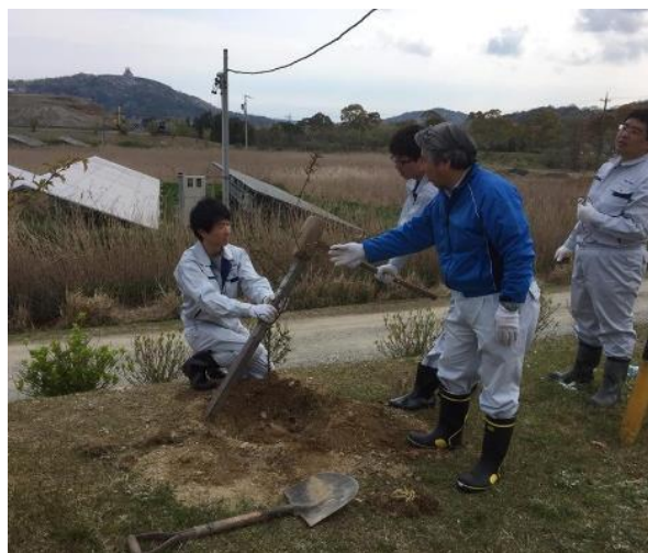
地域の環境ボランティア活動（植樹）に参加