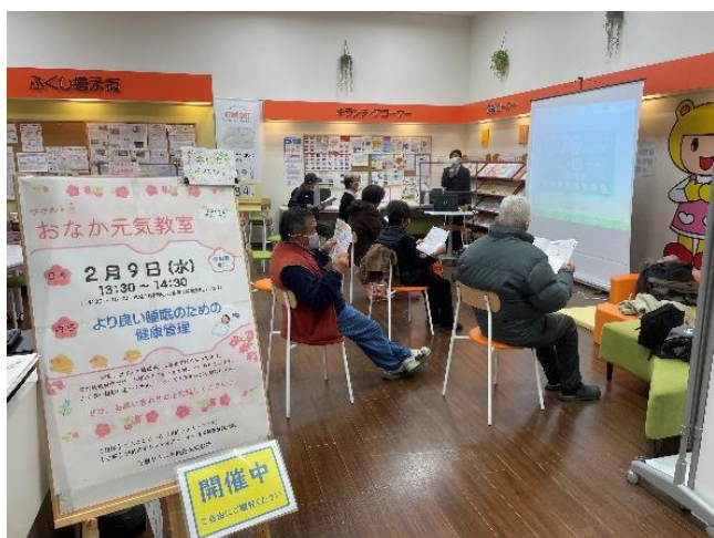
管理栄養士による健康教室

実際の体験をとおして、「自分たちのスキルが地域でどのように役立つか」を感じてもらい、地域での活動を考えるきっかけとします。