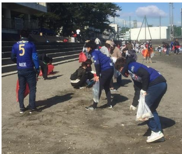
地域の清掃活動に参加（二見浦海岸清掃）

実際に地域で「ボランティア」や「まちづくり協議会」などの主催により実施している「海岸清掃」や「町をきれいにする活動」などに参加し、環境ボランティア活動を体験します。