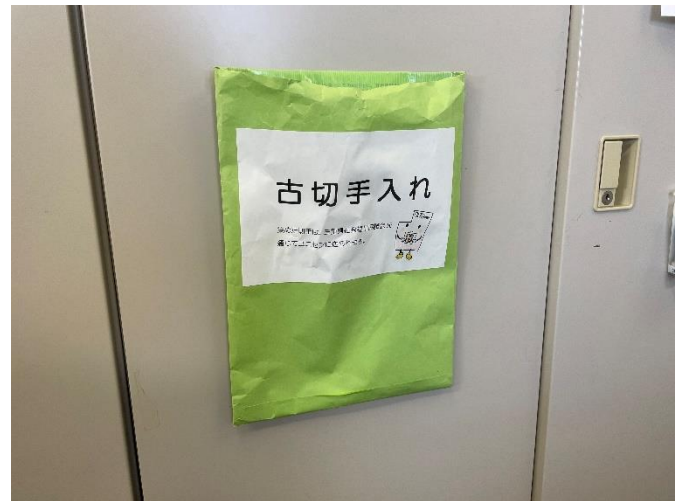
古切手の収集活動（三重県社協を通じてユニセフへ）