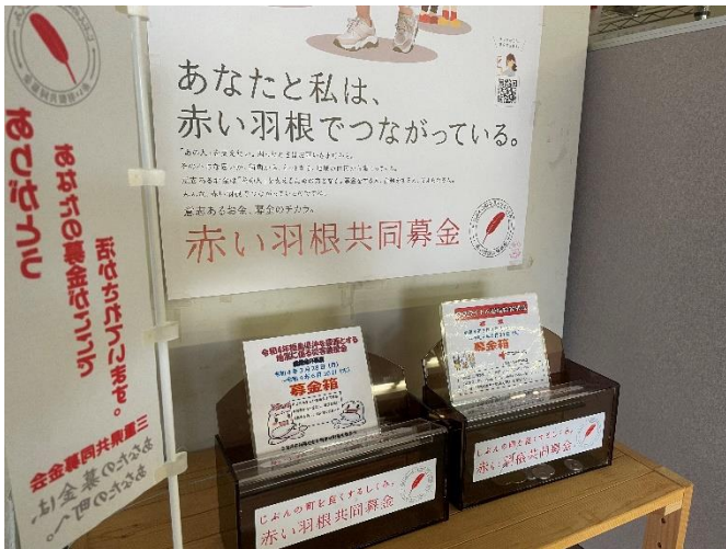
募金活動への協力（店舗内へ設置）