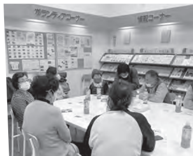
フリースペースわげん