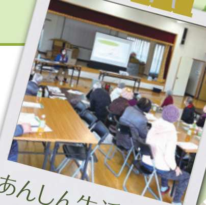
あんしん生活講座