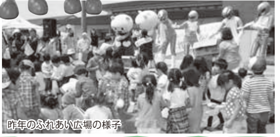
昨年のふれあい広場の様子