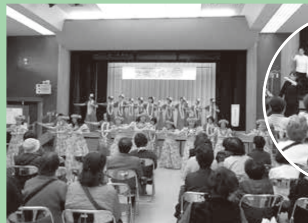
前回のステージ発表

第4回伊勢市福祉健康センターフェスティバルを開催します。「ひとから人へ」をテーマに各利用団体や、センターで開催している「はつらつ教室」「身障デイサービス」受講者によるステージ発表、作品展示、軽食や物品販売など、子どもからお年寄りの皆さんまで楽しめるイベントをたくさん予定しています。皆さんのご来場をお待ちしています。