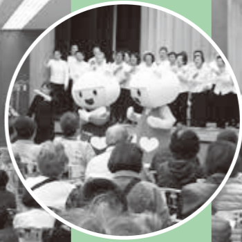
げんきくん、こころちゃんも来るよ