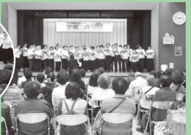
前回のステージ発表