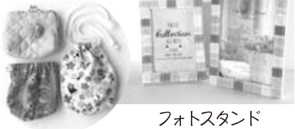
小物入れ▶ フォトスタンド

◎自主製品の販売もしています。また、社協のホームページに詳しく掲載しています。ぜひ、一度ご覧ください。