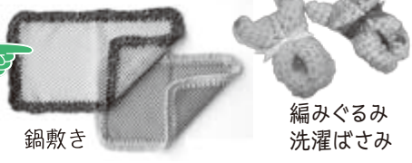
鍋敷き 編みぐるみ洗濯ばさみ