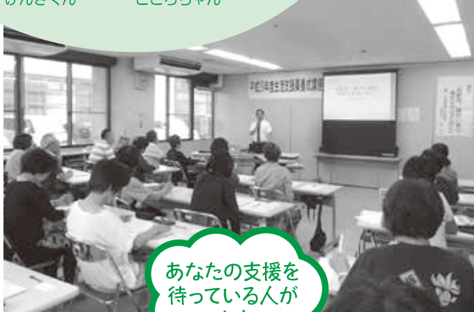
生活支援員養成講座