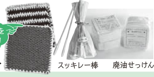
マット▶ スッキレー棒 廃油せっけん