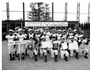
優勝した鶴方少年消防クラブ

1月6日・7日、伊勢志摩地域の18チームによる熱戦が繰り広げられ、鶴方少年消防クラブが優勝し、準優勝は今一色野球スポーツ少年団でした。 伊勢・鳥羽・志摩・玉城・南伊勢の各社会福祉協議会および中日新聞社より、賞状と副賞が贈られました。