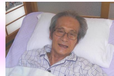
⑥さっぱり気分爽快