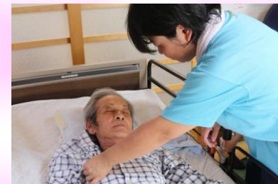
③看護師が健康チェック