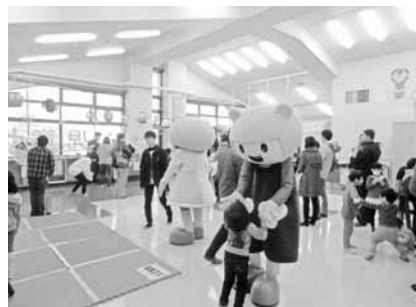
児童センターまつり