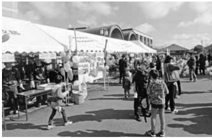
ボランティアセンターフェスティバル