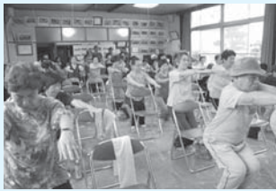
<主な活動場所> 黒瀬町公民館

平成27年5月に立ち上げた新しいサロンです。地域住民の交流の場として仲間づくりを行い、「おたっしや体操」という体操などを取り入れて、健康づくりに力を入れています。みんなで体を動かすことで、楽しいひとときとなっています。