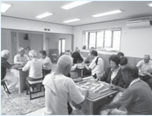
<主な活動場所> 大林寺イベントホール

ほぼ毎週木曜日に開催しています。飲まない、吸わない、賭けないがモットーの「健康麻雀」。皆さん会話を弾ませながら脳トレーニングを楽しんでいます。興味のある人は気軽に参加してください。