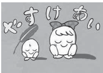
平成26年度 特賞作品

提出方法 作品裏面に学校名・学年・氏名・ふりがなを記入し、夏休み明けに小学校へ 問い合わせ先 伊勢市社会福祉協議会内・伊勢市共同募金委員会(☎208610) ※入賞作品の著作権および著作権は主催者側に帰属します