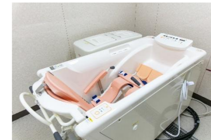
座位のままでも入浴できる機械浴

健幸倶楽部つどいでは、 ご利用者様が 持っている力を 一緒に考え、引き出す ような対応に努めます。