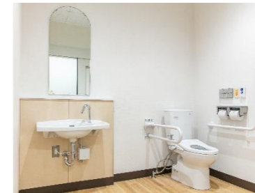
多目的トイレ② 車いすの方でも利用できる スペースを確保しています