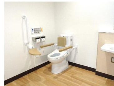
多目的トイレ① 移乗時の動作・姿勢の安定を 図り転倒のリスクを軽減する 前方ボードがあります

トイレは4ヶ所。多目的トイレが2ヶ所、一般用トイレが2ヶ所（男性用・ 女性用）あります。それぞれに手すりを完備しています。