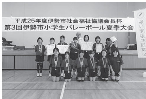
優勝 大湊バレースポーツ少年団

赤い羽根共同募金配分金事業 伊勢市社会福祉協議会長杯 第3回伊勢市小学生バレー ボール夏季大会が開催されました