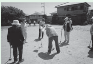
<主な活動場所> 上久保公園

今年4月から活動を始めた新しいサロンです。月2回、体操後に公園の石拾いや草取りなどの清掃活動を行い、グランドゴルフを楽しんでいます。