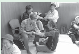
<主な活動場所> 二見健康管理増進センター

毎月第1水曜日と第4日曜日に開催しています。みんな元気で仲よし! 笑いの絶えないアットホーム(家庭的)なサロンです。