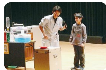
らんま先生ecoサイエンスショー