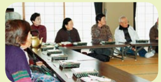
＜主な活動場所＞ 上條公民館

平成24年12月 からス タートした昼食会です!! 毎月第2木曜日に開催し ています。おいしいお弁 当を食べ、ゲームなどし てみんなで“楽しく笑っ て”いきましょう♪