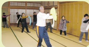
＜主な活動場所＞ 喜楽荘

毎月第3月曜日に開催 しており、ボランティア による健康体操が中心で す。タオルやバランス ボールを使って体を動か したり、歌や脳トレも楽 しまれています。