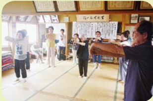
＜主な活動場所＞ 河崎南側公民館

毎月第2水曜日を中心 に開催しています。健康 体操で運動した後は、脳 トレーニングを行い、最 後はみんなでカラオケを 楽しんでいます。