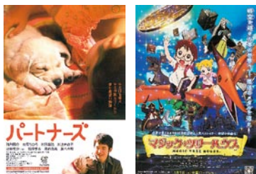
福祉映画上映会 8月15日、2月23日開催

こども会、親子等への助成（108団体）、児童公園遊具等整備補修（9件）、宅老所への助成（2件）、地域見守り活動団体への助成（58団体）、高齢者乳酸菌飲料等宅配サービス（73人）、ふれあい・いきいきサロン（高齢者サロン44、子育てサロン11、障がいサロン2）、協賛金助成（4件）、三世代交流助成（7件）、物品貸出事業等