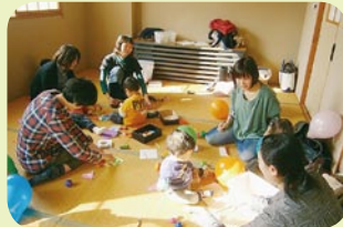
＜主な活動場所＞ 北浜支所

毎月第3火曜日に開催 をしています。子ども同 士、親同士、親子の交流 の場として和やかな雰囲 気で様々なあそびを行っ ています。