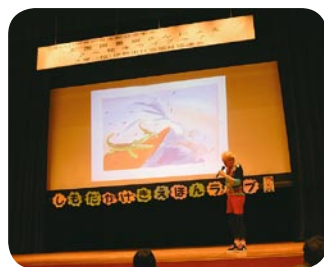
志茂田景樹絵本ライブ 10月2日開催