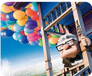
福祉映画上映会 7月31日開催