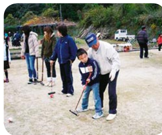
三世代交流（沼木地区） 12月11日開催