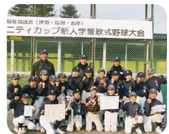
協賛事業（少年野球） 1月11日開催