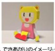
できあがりのイメージ