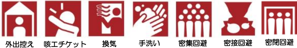
外出控え 咳エチケット 換気 手洗い 密集回避 密接回避 密閉回避

梅雨明けも間近になり、いよいよ夏本番がやってまいります。暑さ対策や熱中症予防に加え、ひとりひとりが感染防止の対策を取り入れた「新しい生活様式」を実践することが求められています。