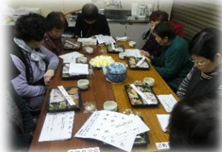
中島地区 京町ふれあい食事会