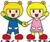
げんきくん・こころちゃん