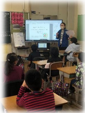
ユニバーサルデザインについて