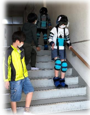
高齢者疑似体験及び介助体験