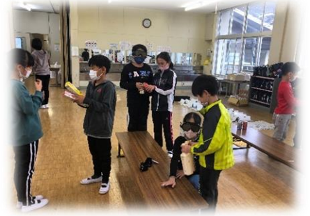
視覚障がい者の理解 (アイマスク体験及び介助体験)

『ユニバーサルデザインって何だと思 う？』と質問すると、『みんなに優しい デザイン』と回答がありました。 素敵な回答で嬉しくなりました。