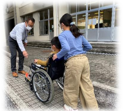
車いす体験及び介助体験