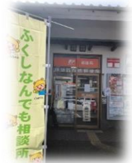
伊勢筋向橋郵便局