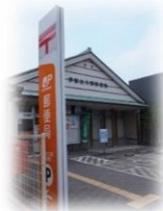
伊勢辻久留郵便局