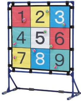
ターゲットゲーム