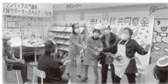
子育て支援ボランティア編