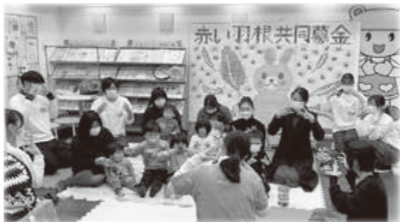
子育てサロンレクびよ(皇學館大学レクリエーション部)