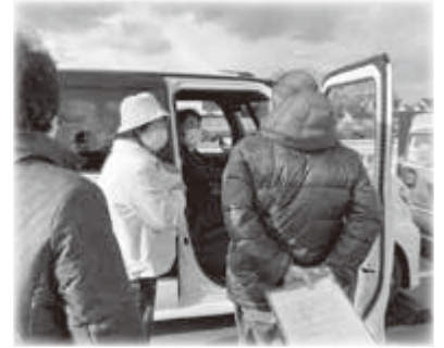
安全運転講習・福祉車両 貸し出しなど