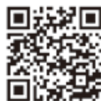
げんこころにゅーす

伊勢市社会福祉協議会のホームページや、げんこころにゅーす・メールマガジン・フェイスブックなどで、ボランティア・各種助成金の情報提供や登録団体の活動を紹介しています!