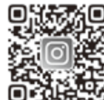
げんこころ一む・Instagram

ボランティア活動を安心・快適に行うために、ボランティア活動保険に加入しませんか? 無償で活動するボランティアが、国内で活動中にけがをしたり、賠償責任を負ったりしたときに、その補償をする保険です。