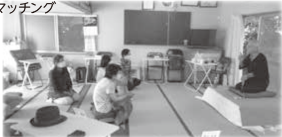
サロンでの落語 個人ボランティア