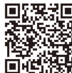
伊勢市ボランティアセンター・フェイスブック