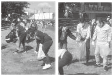
海岸などのごみ拾い