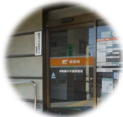
【伊勢御木本郵便局】