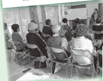
まちづくり協議会の福祉活動助成