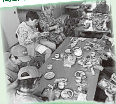
高齢者ふれあい会食会

1人暮らしの人が増えている中、地域で交流する場をつくり、孤立化防止を図っています