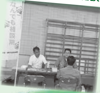
ふくしなんでも相談

1人暮らしの人が増えている中、地域で交流する場をつくり、孤立化防止を図っています