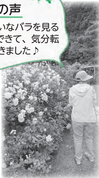
神宮ばら園・おかげ横丁散策