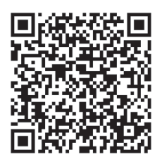
伊勢つながりサポートリスト (子ども・若者版)