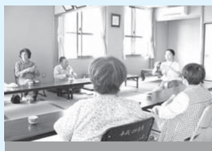
<主な活動場所> 江コミュニティセンター

音楽療法や健康体操、ゲームなどで体を動かしています。無理せず、楽しんで続けられるのはいいですね。