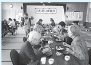
<主な活動場所> 小俣明野保健福祉会館

食事を楽しんだ後は、ピンボウリングなどのレクリエーションを行っています。みんなで得点を競い合い、楽しいひとときを過ごしています。