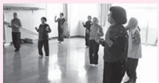
<主な活動場所> 溝口会館

毎週水曜日の晴れの日、会館内で健康体操を行っています。内容は大体決まっております。映像を見ながらの体操や、オリジナルのストレッチ体操などを行っています。 「決して無理はせず、いつまでも健康であるために」と、皆さん積極的に参加しています。