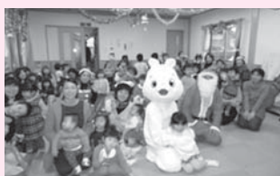
<主な活動場所> 古市公民館

毎月、第2または第3土曜日に開催しています。地域の協力者がさまざまな行事や催し物を企画し、大勢の子育て中の親子を楽しませてあげています。参加者からは「毎回楽しませてもらっています」などの感想があり、地域に根付いている子育てサロンです。