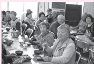
<主な活動場所> 一色町公民館

月1回、みんなで集まり、地元行事のビデオを見ながら、楽しいおしゃべりと笑いの絶えない会食会を開催しています。毎回、手作りの吸い物がおいしいと好評です。