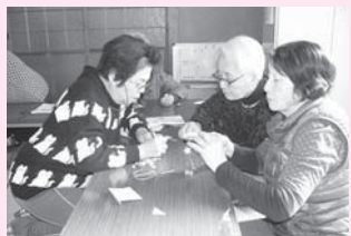
<主な活動場所> 山田原公民館

月に1回開催しています。手芸や料理教室、健康体操をしたり、寄せ植えを楽しんだり、多種多様な活動をしています。物作りの日は、難しいところを協力し合って完成させます。