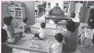
<主な活動場所> 新婦人伊勢支部事務所・2階

平成25年6月から、サロンとして活動を始めました。月1回、絵本や紙芝居の読み聞かせのほか、調理実習なども行っています。おしゃべりをしたり、一緒に遊んだりして、親子で交流を深めています。