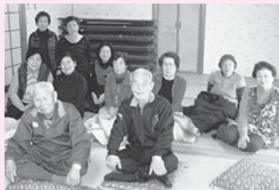
<主な活動場所> 二見老人福祉センター

毎月第3水曜日に開催しています。カラオケや、講師を招いての健康体操、講話など内容も盛りだくさんです。皆さん積極的に参加され、元気いっぱい、笑顔いっぱいのサロンです。