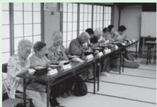
<主な活動場所> 福祉健康センター

毎月1回、福祉健康センターで開催しています。合唱や輪唱、踊りの披露など毎回違った催し物を行い、その後はみんなで楽しく昼食を食べています。