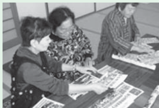
<主な活動場所> 西コミュニティセンター

第4水曜日に開催しています。平成25年度は、人数が増えてにぎやかになっています。いつも、脳トレニングや歌、ゲームをしてたくさん笑います。その後みんなで食べるお弁当は格別ですね。