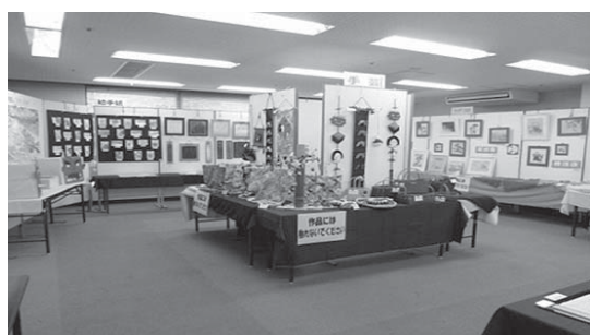
昨年度のはつらつ教室作品展の様子

• 28日：健康太極拳体験(午前10時～10時30分)、手話歌発表・体験(午前11時～11時30分)、筆ペン体験(午後1時～3時)、作品展 • 1日：フラダンス発表・体験(午前11時～正午)、健康体操体験(午後1時～1時30分)、ヨガ体験(午後2時～2時30分)、作品展 問い合わせ先 社会福祉協議会伊勢支所