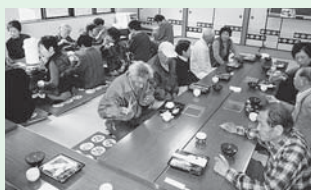
<主な活動場所> 一字田町公民館

平成24年度からスタートした会食会で、毎月1回開催しています。昼食の前後には、講話やレクリエーションを行い、みんな楽しく交流しています。