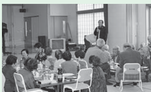
<主な活動場所> 馬瀬町公民館

平成24年度から開催している会食会です。おいしい弁当を食べた後、歌や踊りなどの楽しい催しが盛りだくさん。芸達者が勢ぞろいの会食会です。