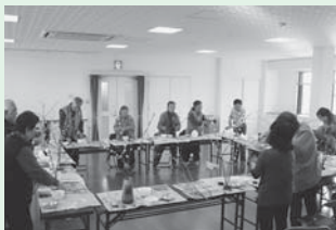
<主な活動場所> 黒瀬市民館

主に第3水曜日に開催 しています。ゲームや体 操・茶話会のほか、春は 花見、夏は七夕、冬は花 餅作りなど、季節に応じ た活動を楽しみ、交流を 大切にしています。