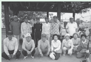
<主な活動場所> 宮前公園

今年4月から活動を始 めた新しいサロンで、月 3回活動をしています。 皆さん元気にグラウンド ゴルフを楽しみながら、 腕を磨いています。