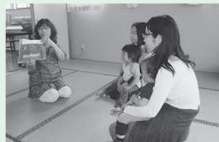
<主な活動場所> 宮前保健福祉会館

毎月第3木曜日に、親子で一緒に体を動かしたり、絵本を読んだり、親子・子ども同士の交流があったりと、楽しく活動をしています。