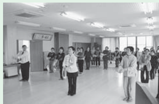
<主な活動場所> なごみの館、高向公民館

毎月第3木曜日に開催しています。健康体操・ゲーム・折り紙教室など内容はさまざま。楽しいサロンをみんな心待ちにしています。