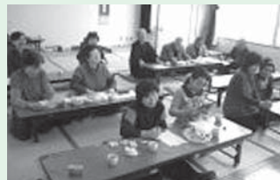
<主な活動場所> 昭和苑会館

主に毎月第3土曜日に活動し、カラオケや唱歌を歌ったり、脳トレーニングなどを行ったりしています。その後は、本格的に抹茶を立て、おやつを楽しんでいます。