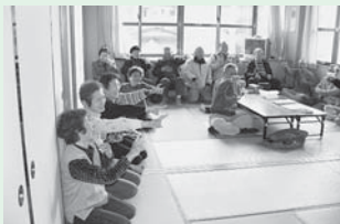
<主な活動場所> 江コミュニティセンター

今年度から毎月第3水曜日の開催に変更となりました。月1回、主にカラオケを楽しんでいます。年に1回、講師の先生を招き、歌に合わせて楽しく体操をしています。