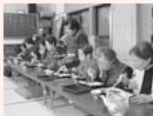
<主な活動場所> 久志本公民館

毎月第2火曜日を中心に活動しています。会話を弾ませながらの食事は最高です。また、食後はみんなでカラオケを楽しんでいます。