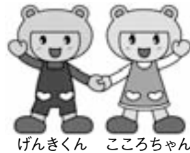
げんきくん こころちゃん

社協だよりは、今回から「広報いせ」の中に掲載することになりました。隔月発行から毎月発行となり、市民の皆さまへ、より一層の情報を提供できますよう努めてまいりますので、今後とも社協だよりをよろしくお願いいたします。