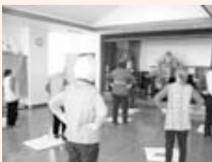
<主な活動場所> 溝口会館

毎週水曜日に活動しています。曲に合わせて健康体操をします。無理はしないようにと、みんなで声を掛け合って体力づくりをしています。