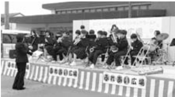
昨年の「ふれあい広場」の様子

広場：屋台など 問い合わせ先 伊勢市社会福祉協議会二見支所内・ふれあい広場実行委員会事務局 (☎④55551)