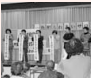
<主な活動場所> 一色町公民館

約70人が集まり、よもやま勉強会、マジックショー、元看護師さんによる血圧測定など、皆さん楽しみにされています♪