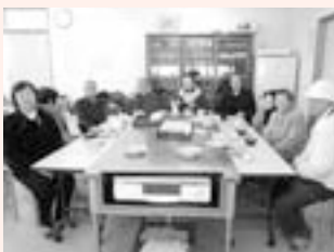
<主な活動場所> 宮前保健福祉会館

毎月第3木曜日に活動しています。おしゃべりを楽しんだり、得意の編み物を披露したり、皆さん楽しいひとときを過ごしています。