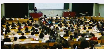
第20回TOKYO大会の分科会風景

全国のボランティア・市民活動に関する情報交換と三重県内のボランティア・市民活動の推進などを目的に開催され、伊勢市内でも分科会が行われます。今後、三重県社会福祉協議会ホームページにて随時情報を発信していく予定です。ご興味のある方は、是非、ご参加ください。