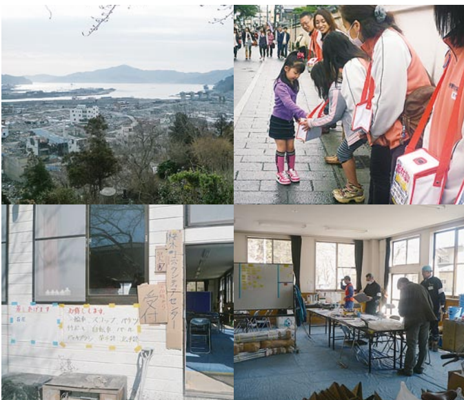
大槌町災害ボランティアセンター（桜木保健福祉会館）

東日本大震災により、犠牲になられた方々のご冥福をお祈りするとともに、被災された皆様には心からお見舞い申し上げます。