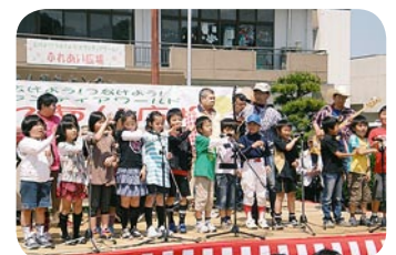
昨年の「ふれあい広場」