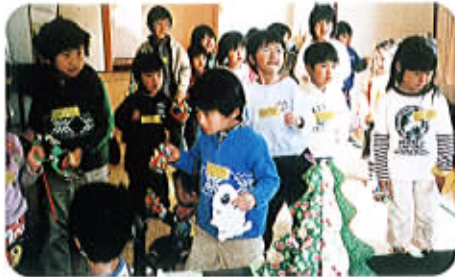
みんなで子育てを楽しんで、親子ともども仲良くなりませんか？

プレゼントの交換では、何が当たるか、ドキドキしながら、親子一緒になって歓声を上げていました。