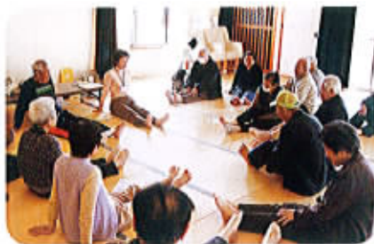
ふれあい・いきいきサロン参加についてのお申し込みは下記まで