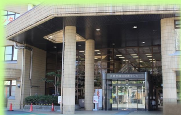
福祉健康センター 正面玄関